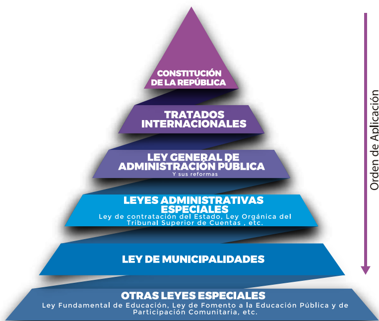
Ilustración 1. Preeminencia legal de las leyes para los gobiernos municipales