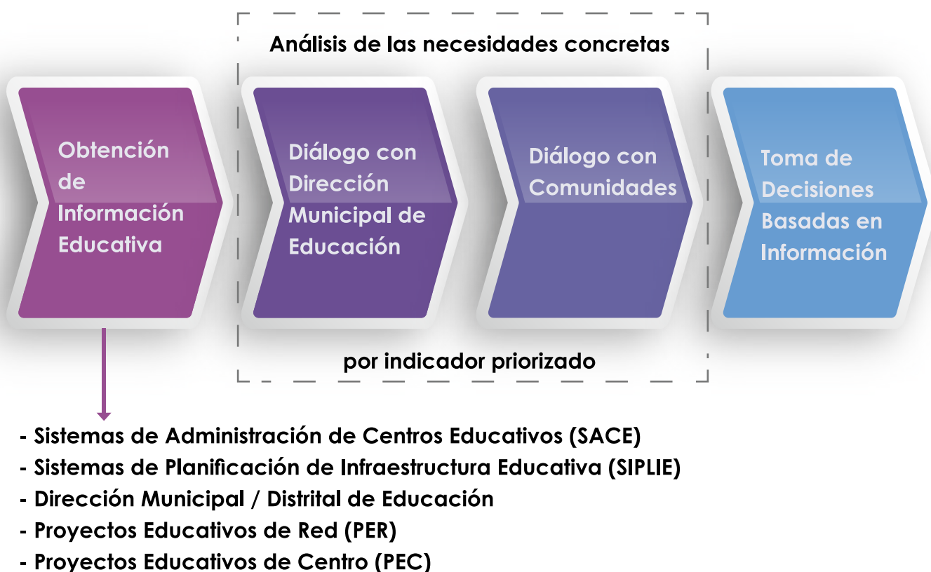
Ilustración 4. Toma de decisiones sobre las inversiones

Para apoyar en el análisis y la toma de decisiones sobre las inversiones a realizar, a continuación, se presentan algunas opciones que pueden considerar los Gobiernos Locales como complemento a los aspectos que son responsabilidad de inversión del Gobierno Central a través de la Secretaría de Educación. Cualquiera que sea la opción que se utilice, contenida o no en este documento, se recomienda considerar seguir la siguiente lógica para determinar cuál es la mejor forma de invertir: