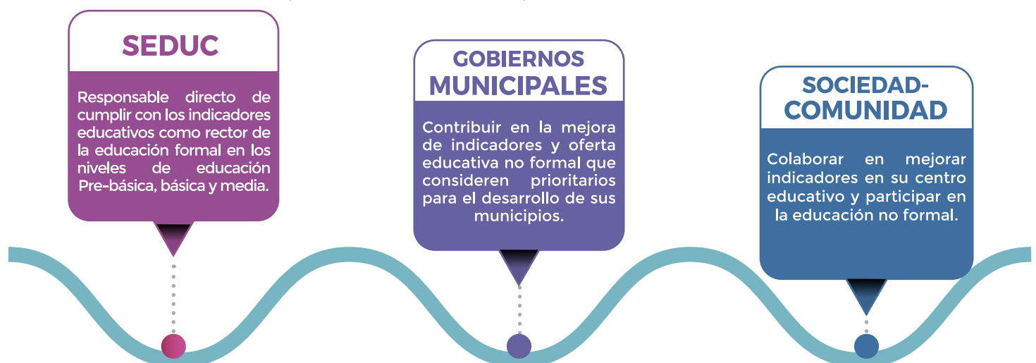
Ilustración 2. Responsabilidad del cumplimiento de indicadores educativos

Son estos actores los responsables directos de garantizar que los niños, niñas y jóvenes adquieren los conocimientos y las competencias necesarias para afrontar los retos de una sociedad en constante evolución. No obstante, debido a la complejidad del Sistema Educativo Nacional y las limitaciones del Gobierno Central, el cumplimiento de algunos de los indicadores educativos requiere del apoyo continuo y sistemático de otros actores como los gobiernos municipales, las organizaciones no gubernamentales (ONG), sector privado, la cooperación internacional, los padres y madres de familia, sociedad civil organizada y todos los ciudadanos, pero siempre manteniendo la responsabilidad directa la Secretaría de Educación.