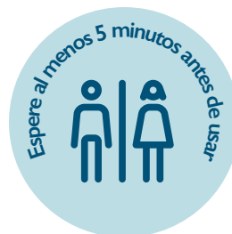
Señalización de baños