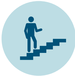
Señalización de escaleras, espacios de circulación