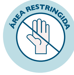
Señalización de zonas restringidas, no pasar, acceso denegado.