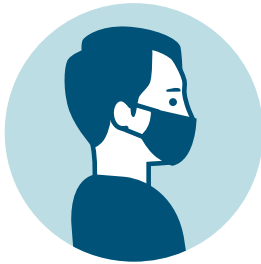
Uso obligatorio de mascarilla