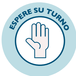
Espera su turno