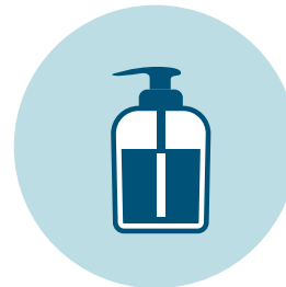
Dispensadores de gel

Los símbolos y figuras son referenciales, existen otras opciones disponibles en el internet.