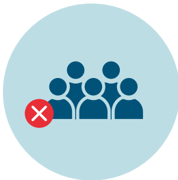
Mantenga el distanciamiento