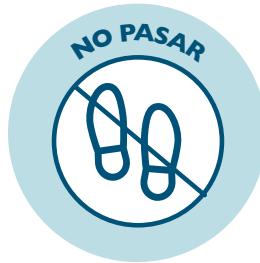
Señalización de No pasar