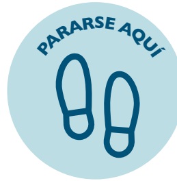
Distanciamiento social de dos metros: figuras en el piso con rueda y pies o una x