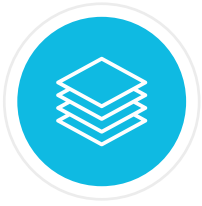
Tabla de Índice