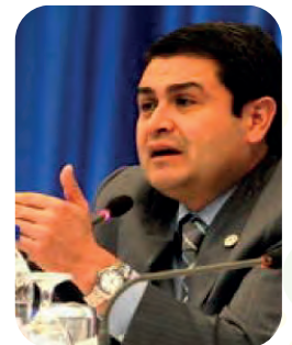
Abog. Juan Orlando Hernández, Presidente de la República

Esta alianza con los alcaldes es por darle al pueblo Una Vida Mejor