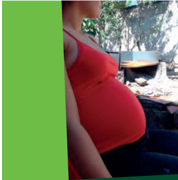
La AMHON coordina el Cluster que ejecuta el proyecto