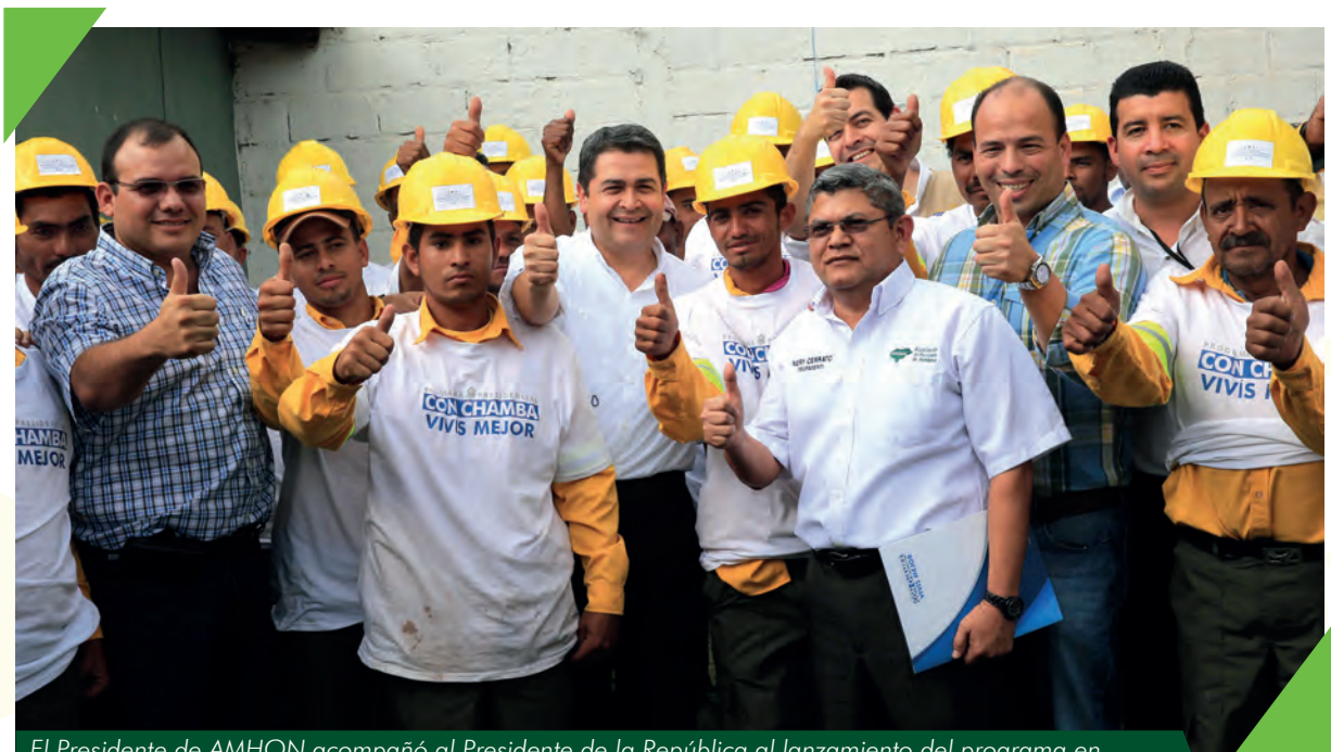
El Presidente de AMHON acompañó al Presidente de la República al lanzamiento del programa en Gualaco, Departamento de Olancho.

“El programa busca mejorar la economía familiar en los 298 municipios de país”