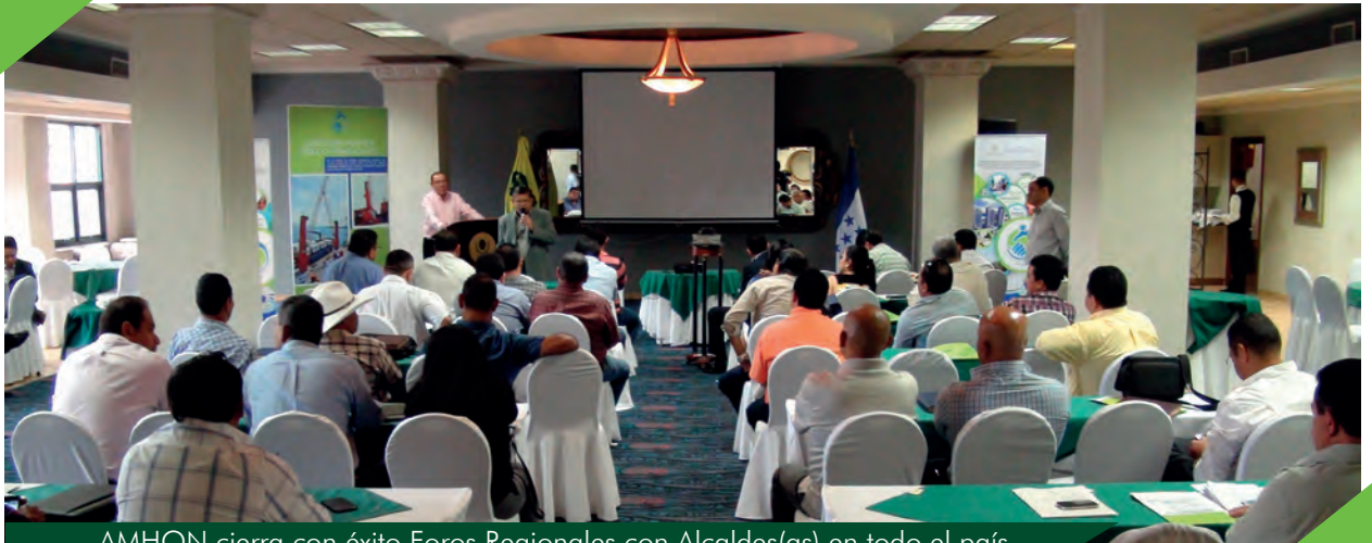
AMHON cierra con éxito Foros Regionales con Alcaldes(as) en todo el país.

Los encuentros sirvieron de plataforma para el abordaje de temas de interés municipal.