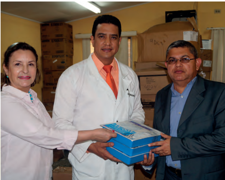
El Presidente de AMHON recibe medicamentos de CEPUDO y a la vez los entrega a las instituciones beneficiarias.

La Asociación de Municipios de Honduras (AMHON) y la Asociación de Proyección Social sin fines de lucro Capacidad, Educación, Producción, Unificación, Desarrollo y Organización (CEPUDO) firmaron un convenio de cooperación para la entrega en donación de bienes, servicios y capacitaciones a favor de familias hondureñas viviendo en extrema pobreza y vulnerabilidad física y socio-económica que se encuentran en los 298 municipios del país.