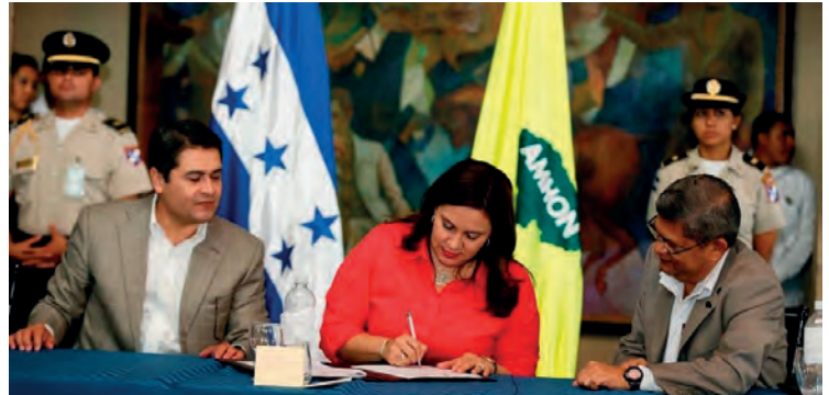
La Primera Dama de Honduras Ana García de Hernández, avala el pacto como testigo de honor

“Deseamos expresar nuestra profunda voluntad para unir esfuerzos que conduzcan a la complementariedad de las políticas públicas nacionales y locales, a fin de propiciar las condiciones que mejoren los niveles de vida de la población, generando fuentes de empleo digno, fortaleciendo la mediana y pequeña empresa rural y urbana, mejorando el clima para la inversión, cohesionando el tejido y participación social, bajo una cultura de paz y unidad nacional”, reza el contenido del Pacto Municipal Por Una Vida Mejor firmado en presencia de los Alcaldes y Alcaldesas en Casa de Gobierno, teniendo como testigo de honor a la Primera Dama de la Nación Ana García de Hernández.