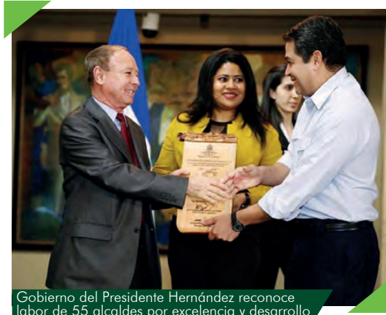
Gobierno del Presidente Hernández reconoce labor de 55 alcaldes por excelencia y desarrollo