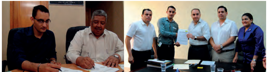
Alcaldías de Catacamas, El Progreso y San Pedro Sula firman acuerdo para ejecutar el programa de Niños Retornados no Acompañados.

La AMHON-Programa de las Naciones Unidas para el Desarrollo (PNUD), firmaron convenio para la implementación de agendas municipales para la atención integral de niños y jóvenes migrantes retornados en San Pedro Sula, Catacamas y El Progreso, por un monto de US$ 111,000.00 (ciento once mil dólares).