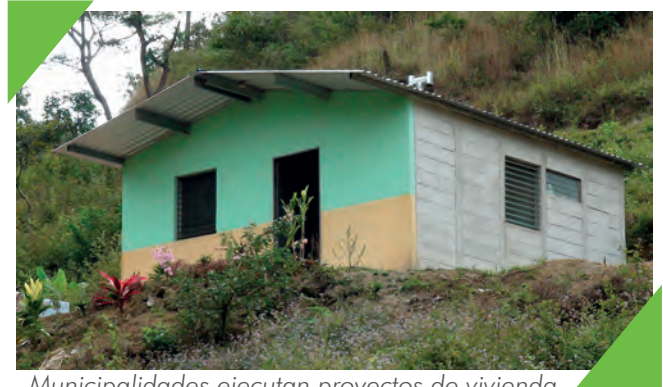
Municipalidades ejecutan proyectos de vivienda en coordinación con el gobierno central

Se están construyendo viviendas en todos los municipios, tanto en las zonas rurales como en el casco urbano. Son más de 800 viviendas que las municipalidades han construido con apoyo del gobierno central, a través del Programa CONVIVIENDA.