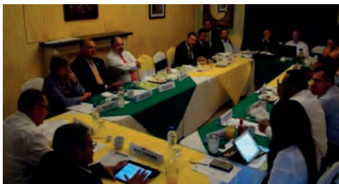
Reunión con Jefes de Bancada al Congreso Nacional para socializar los motivos de la ley

En conjunto con la Gerencia de Planificación y con ejecutivos de CONATEL se trabajó afinando una propuesta final en términos del pago de los operadores de telecomunicaciones, para elaborar y definir la AMHON la reforma del Decreto 55-2012 sobre el Impuesto Selectivo a los servicios de Telecomunicaciones.